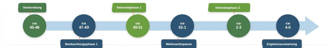
Abbildung 1: Vorgehensweise

Phase 1 Planung Die erste Phase des Projektes begann in der KW 45 und ging bis zum Ende der KW 46 des Jahres 2025.